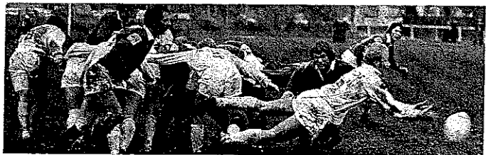
Cupfinalen Uppsala — Enköping

Under tiden 20-21 augusti höll juniorlandslaget ett träningsläger i Halmstad arrangerat av F 14.