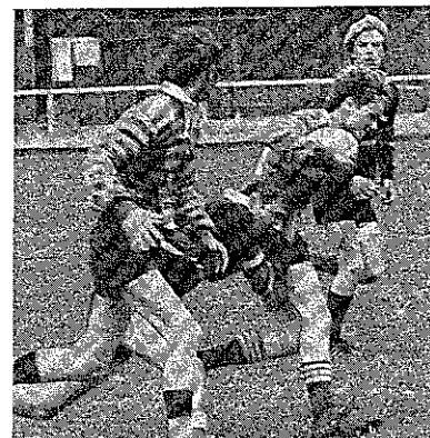
Pojk-SM i Tomelilla